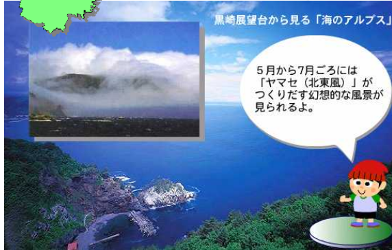
黒崎展望台から見る「海のアルプス」