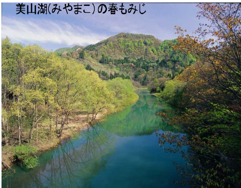
美山湖(みやまこ)の春もみじ

厳しい冬を耐えた樹々は、冬のモノクロームから春の訪れとともに萌黄(もえぎ)色や薄紅色など様々な色をまとい「春もみじ」の季節を迎えます。